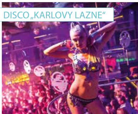
DISCO „KARLOVY LAZNE“

Weiter geht's zur After-Boat-Party, ihr habt freien Eintritt in die angesagtesten Clubs. Mit dem Pub Crawl am Samstag und freiem Eintritt in die größte Disco Mitteleuropas ist das Partyweekende perfekt!